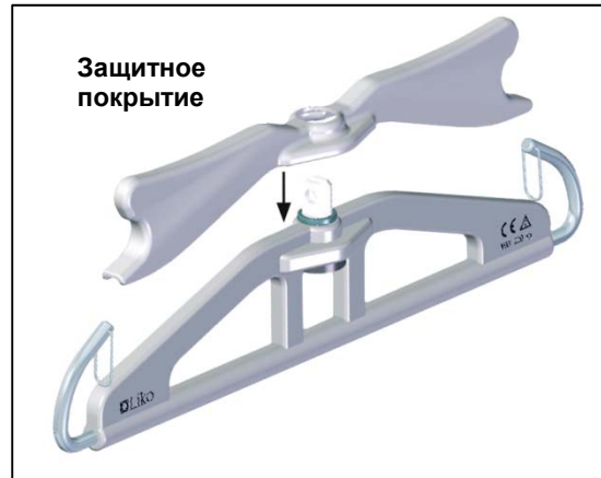
Рисунок — защитное покрытие

Продолжайте соблюдать технику безопасности при работе с подъемниками и не позволяйте неуполномоченным лицам, особенно детям, находиться рядом с подъемником или работать с ним.